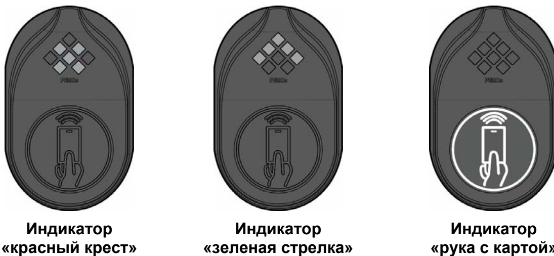
Рисунок 2. Индикаторы блока индикации

Кроме того, ЭП снабжена индикатором «строка», расположенным на переднем торце крышки стойки. Индикатор предназначен для дополнительного информирования пользователя о запрете или разрешении прохода через ЭП.